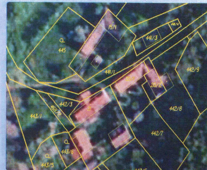
Ortofoto s obrazem katastrální mapy

Údaje o hranicích pozemků je možné zpřesnit dvěma způsoby. Pokud vlastníci mají označeny nesporné hranice pozemků v terénu (zdmi, ploty, hraničními znaky v lomových bodech), zeměměřič tyto hranice zaměří, a po porovnání s dosavadními méně přesnými údaji vyhotoví geometrický plán.